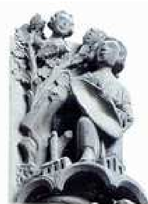
Gedeone e l'Angelo- Chartres

Un altro episodio è quello di Gedeone, che si lamenta con il Signore. Giudici 6, 13 : Signore mio, se il Signore è con noi, perché ci è capitato tutto questo? Dove sono tutti i suoi prodigi, che i nostri padri ci hanno narrato, dicendo: Il Signore non ci ha fatto forse uscire dall'Egitto? Ma ora il Signore ci ha abbandonati e ci ha messi nelle mani di Madian. Gedeone viene chiamato dall'Angelo: Io sarò con te e tu sconfiggerai i Madianiti, come se fossero un uomo solo. Giudici 6, 16. Gedeone offre all'Angelo, in segno di ospitalità, carne e 40 chili di farina per preparare focacce.